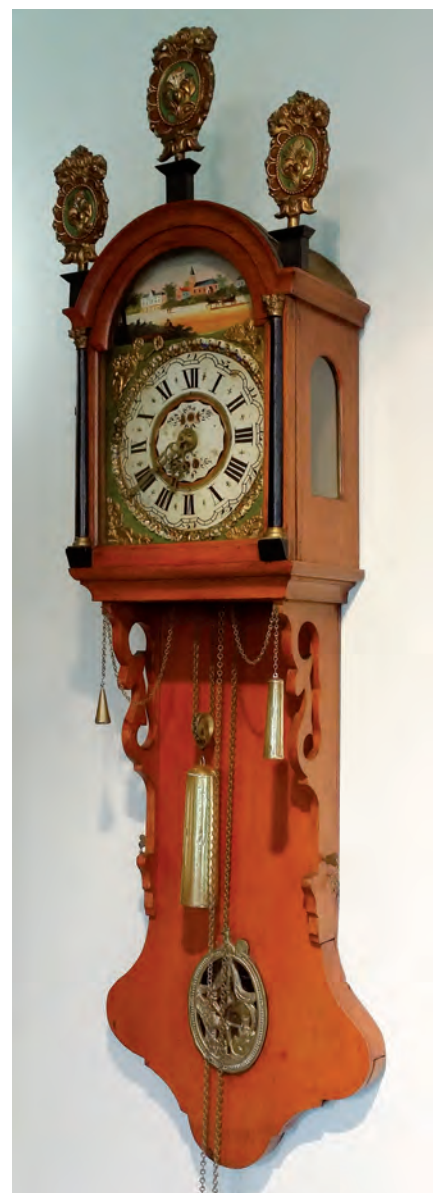
Afb. 4. Klok van Abel Pieters Plantinga.

er een staartklok uit Zeeland met op de wijzerplaat een dorpsgezicht van Joure anno 1855, gezien vanaf de Tolhuisbrug richting het water De Kolk. De klok is gemaakt door J. Vijlstra, de oud-werkgever van Willem Hak en geschilderd door Folkert Hylkes Plantinga. Ooit was deze klok een speciale bestelling geweest van de horlogemaker W. Hak. Zijn gedrukte kaartje zat namelijk in de staart van de klok. Het is niet bekend waar deze staartklok nu is.