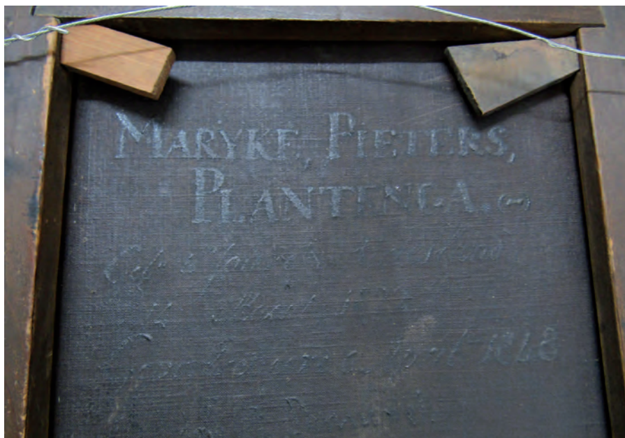
Afb. 3. Achterzijde van het portret van Marijke.

Onder de floddermuts is een gouden oorijzer met rijk bewerkte gouden potknoppen die boven de muts uitsteken. Ze draagt een bruin jak met een zwarte zijden of fluwelen strik en zwarte biezen. Ze draagt een halsketting met een gouden slot, van wat ik eerst dacht, van bloedkoraal was maar het blijkt facetgeslepen carneool te zijn. Kornalijn past rond 1848 helemaal in het modebeeld.