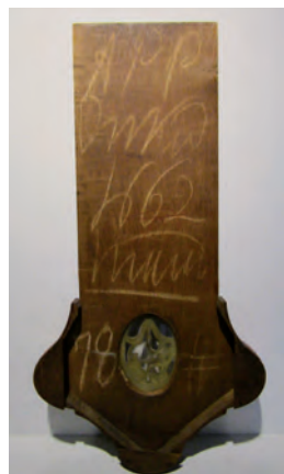
Afb. 5. Achterzijde van de schuif.

De klok is in de bloeiperiode van de klokkenmakerijen, zo rond 1850, in Joure gemaakt. De eikenhouten kast van de staartklok is meekraprood geschilderd, waardoor de klok een duurdere