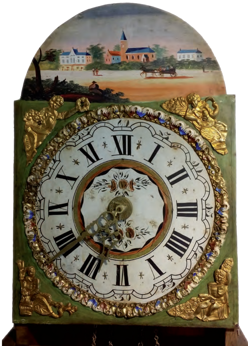
Afb. 6. De wijzerplaat met hoekfiguren.

makersknecht en werd later klokkenmaker. Na zijn huwelijk werkte hij eerst in de Vissteeg en vertrok in 1867 een paar jaar met zijn gezin naar Koudum waar hij zich als uurwerkmaker vestigde. Hij kwam later weer terug naar de Vissteeg in Joure.