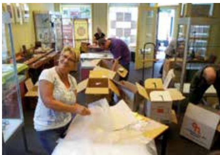
Pand 101 inruimen en in juli weer uitruimen