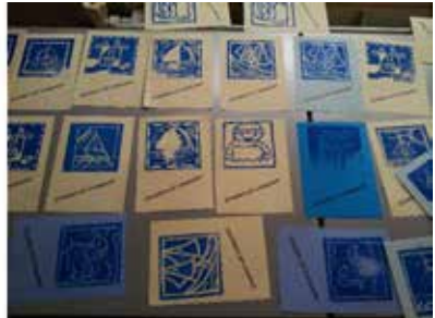
originele linoleumdruk kaarten door 't Swannestee uit Langweer