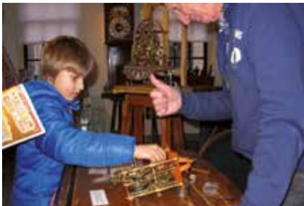
als uurwerkmaker aan de slag