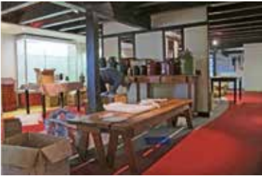
leegruimen van JHP

Na de herinrichting van het Ambachtengebouw in 2012 kwam vervolgens in 2013 het Johannes Hessel Pakhuis (JHP) aan de beurt voor een grondige renovatie. Op collectiegebied hield dit nogal wat in. De hele collectie koffie-thee-tabak moest ingepakt en grotendeels overgebracht worden naar een tijdelijk gehuurd buurpand aan de Midstraat. Gelukkig hoefde de bezoeker zo niets van de collectie te missen. De vele koffiemolens, zetmethodes en kwetsbare theekopjes en meer, zijn met de hulp van vrijwilligers en medewerkers