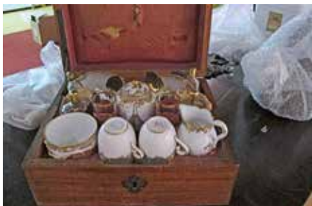
kwetsbare objecten inpakken