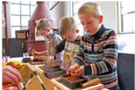
gietmallen maken in de geelgieterij