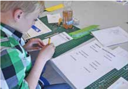
administratie inkoop materiaal bijhouden

Museum Joure is een van de participanten van Joure Ambachtstad: Wetenschap, Techniek en Ondernemen binnen het onderwijs stimuleren door een ondernemende houding en aanbod. Regelmatig overleggen de partijen. Op 29 mei was er in 't Haske een Open Dag voor het onderwijs. Museum Joure heeft daar haar programma gepresenteerd. Naast techniek heeft het stukje ondernemerschap een plaats gekregen binnen de educatie in het museum. Voorbeelden van bedrijvigheid zijn er genoeg: logo, klantenbinding, inkoop, productie, reclame. Het museum is dan als het ware kenniscentrum, inkoopcentrum en productiehal ineen.