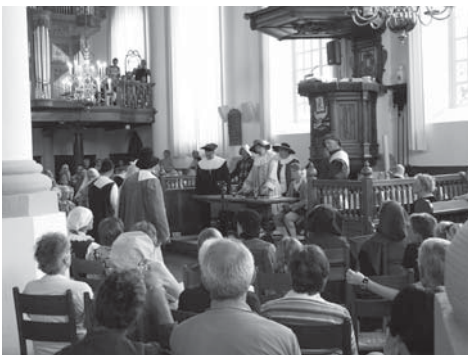
Het Projectteam Rjochtdei

Een aantal jaren is er door diverse mensen hard gewerkt aan de realisering van Rjochtdei. Natuurlijk werd gehoopt dat het een succes zou worden, maar dat alles zo goed zou slagen was boven verwachting. Wie geweest is in 2008 zal er in 2010, als het hem/haar enigszins mogelijk is, zeker weer bij willen zijn.