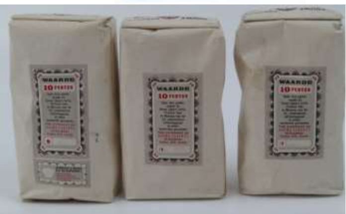
Enkele objecten die in 2015 zijn verworven.