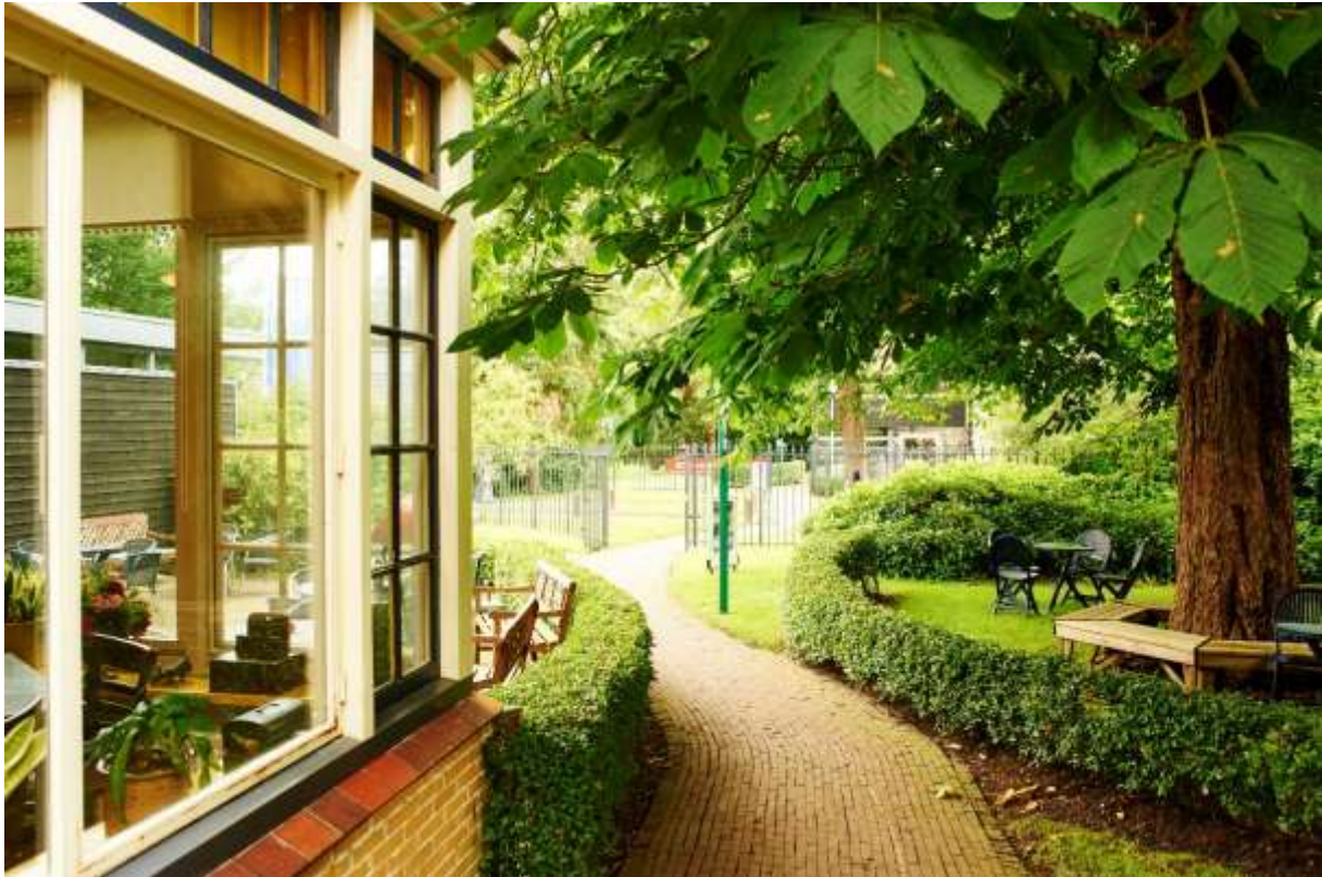
Een blik op de mooie kastanjeboom naast het Koffie- en Theehuis

Een klusteam van vrijwilligers zorgt voor allerlei andere kluswerkzaamheden, van het opknappen van tuinbankjes tot het belichten van tentoonstellingen. Het onderhoud van de tuin is in 2015 deels uitbesteed aan Empatec. Kleinere klussen worden gedaan door een tweetal vrijwillige tuinmannen.